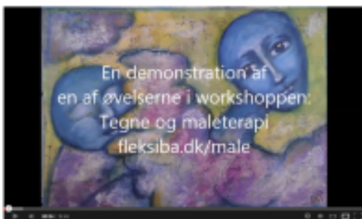
Algot: Tegne og Maleterapi - Workshop fleksiba.dk/male

Klik her for at se eksempler på teknikker i nogle af mine videoer, der ligger på youtube